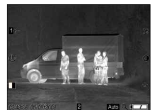
Identifikation von Personen